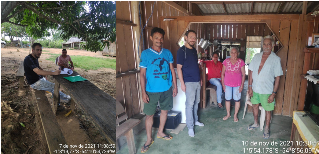
Figura 02: Atualização 2021 da avaliação socioambiental do entorno.

Destaca-se também o processo de cadastramento dos coletores que adentram dentro da UMF IX para realizar as coletas de castanha do Pará.